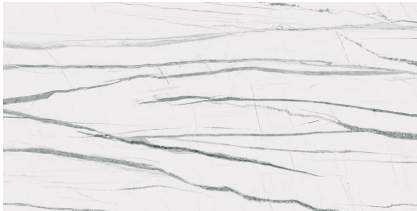
DAREN BLANC PULIDO P6012V