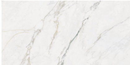
RAVENA NATURAL P6012L