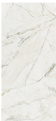
RAVENA PULIDO XL2612V