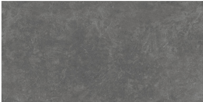
TOGA P BLACK XL2412E