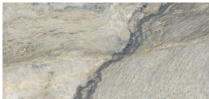
ANIKSA PULIDO XL2612P