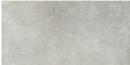
BETONHOME PEARL P6012L