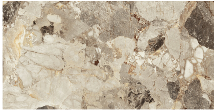
DELOS EARTH PULIDO PS6012GRP