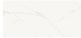
FINEZZA BIANCO NATURAL XL2612L