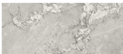
GLASTONBURY GRIGIO XL2812RB