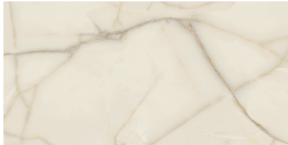
NEWBURY PULIDO XL2412P