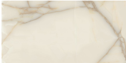
NEWBURY PULIDO P6012P