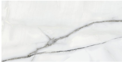
NEWBURY WHITE PULIDO P8016P