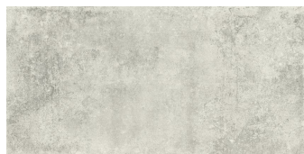
NICKON STEEL P6012L