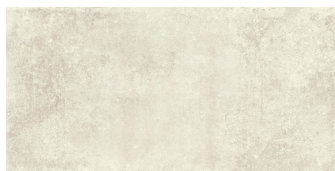
NICKON BONE P6012L