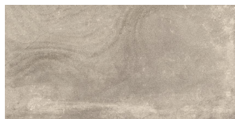
NICKON TAUPE P6012L