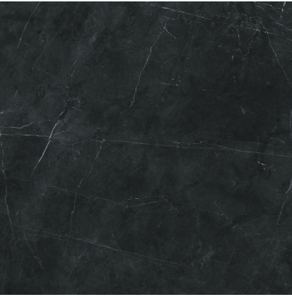
TESSINO BLACK PULIDO PR8080GRP