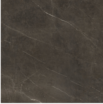
TESSINO BRONZE PULIDO P1212GRP