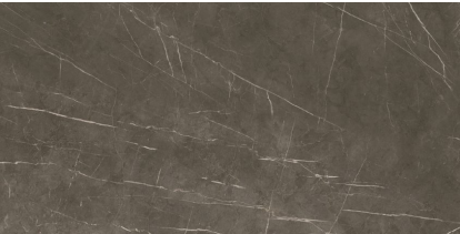
TESSINO BRONZE PULIDO RECTIFICADO P6012GRP