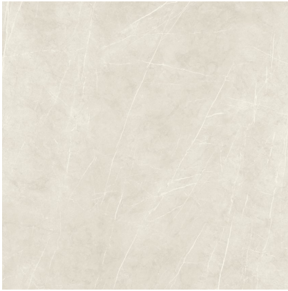
TESSINO IVORY NATURAL P1212L