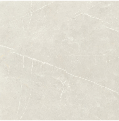
TESSINO IVORY PULIDO PR6060P