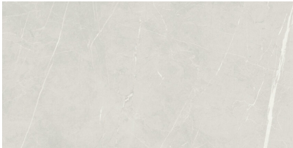
TESSINO SMOKE NATURAL P6012L