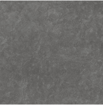
TOGA BLACK P1212E