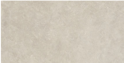
TOGA TAUPE P6012L